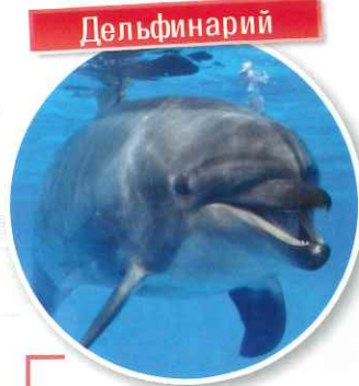
Здесь вы насладитесь захватывающим шоу дельфинов. А если во время шоу вас изберут в помощники, то у вас будет возможность прикоснуться к дельфину и погладить его.