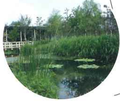
Воссоздана водная среда г. Ниигата: заливные рисовые поля, донные озёра и т. д.