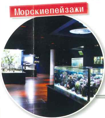
Воссоздана среда семи морских берегов с кораллами, приливными отмелями и представлены местные обитатели.